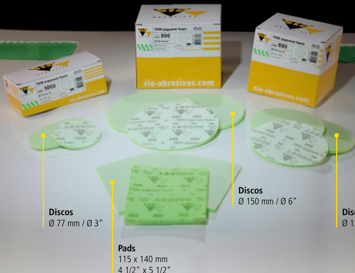
Discos Ø 77 mm / Ø 3"